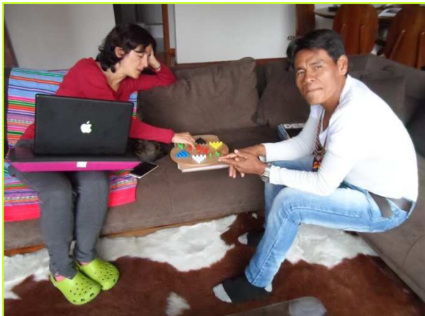
Dag 4 dag van de arbeid: Even een potje chinees dammen tijdens het corrigeren van een onderdeel van de sociaaleconomische studie met een mevrouw van het INCODERteam.