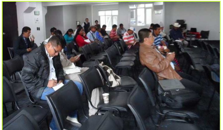
Dag 1 nationaal congres: Nog best wat lege stoelen.