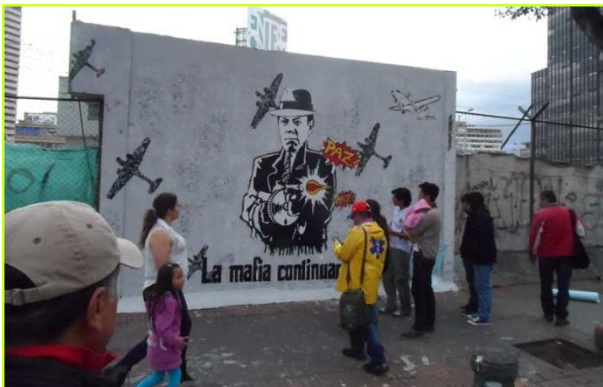
Ergens op straat: Oneens met de hervierkiezing van de huidige president Santos want "de mafia zal doorgaan".