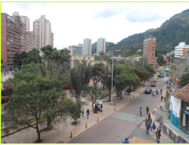
Dag 1-3&5 nationaal congres: Uitzicht.