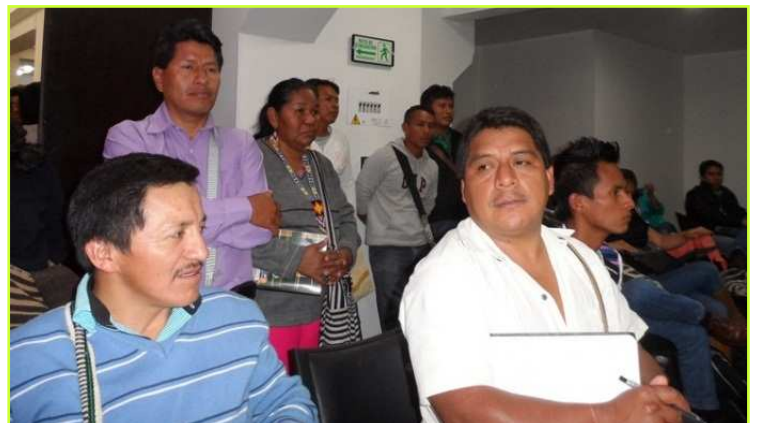
Dag 2 nationaal congres: Delegatie Amazone op de achtergrond