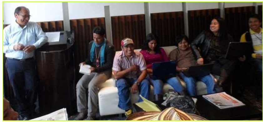
Dag 2 nationaal congres: Samen op de bank in de lobby van het hotel om de situatie in Colombia wat betreft de erkenning van het voorouderlijk grondgebied van de inheemse volken samen te vatten.