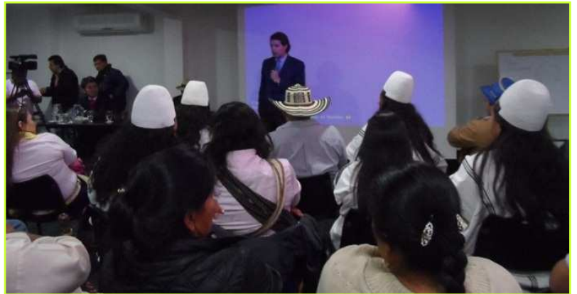
Dag 5 nationaal congres: Alleen de viceminister van Binnenlandse Zaken komt de conclusies van het congres aanhoren...